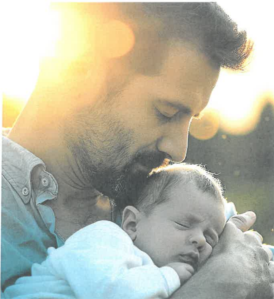
Im Zentrum steht das Wohl des Neugeborenen.

zeitig, wenn der Vater beziehungsweise die Ehefrau der Mutter wieder eine Erwerbstätigkeit aufnimmt. Stirbt der Vater des Neugeborenen beziehungsweise die Ehefrau der Kindsmutter innerhalb von sechs Monaten nach der Geburt des Kindes, hat zudem die Mutter Anspruch auf zwei zusätzliche Wochen Urlaub, die gemäss den Modalitäten des Vaterschaftsurlaubs bezogen werden können.