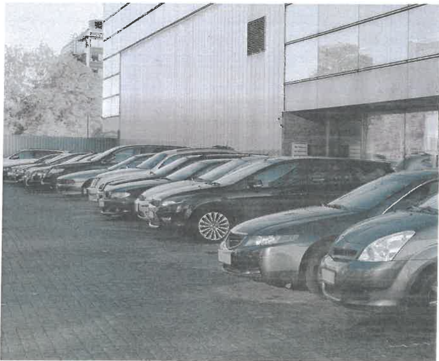
Mit der neuen Regelung entfallen die Aufrechnung für den Arbeitsweg und der Fahrkostenabzug bei der direkten Bundessteuer.

Lesen Sie mehr zum Thema im aktuellen Blogbeitrag von TREUHAND|SUISSE: www.treuhandswiss.ch/blog