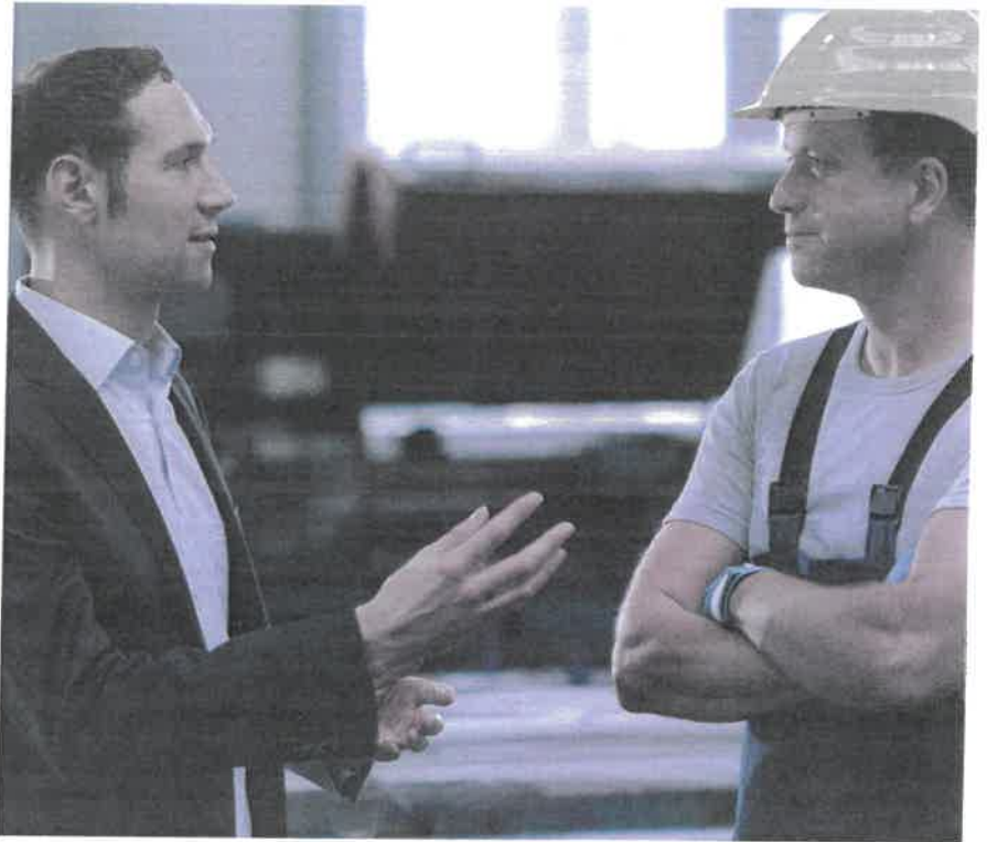
Das Mitarbeitergespräch ist keine Nebensache. Nehmen Sie sich Zeit und hören Sie zu.

Sinnvollerweise wird für das Mitarbeitergespräch zudem ein über die Jahre gleichbleibender Beurteilungsbogen mit einer Bewertungsskala (mit Smileys, Ampeln, Zahlen oder Buchstaben) verwendet.